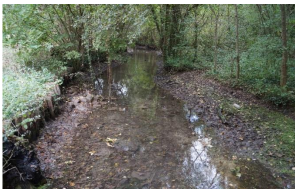
2018-La Nouère avant travaux