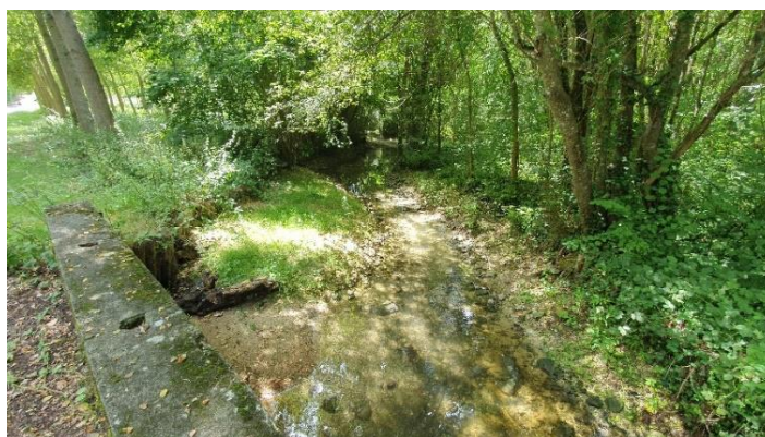
2019-La Nouère 10 mois après les travaux

Afin d'instruire les deux DIG déposées, 1 commissaire enquêteur a été désigné par la Préfecture de la Charente pour assurer le suivi des deux enquêtes publiques.